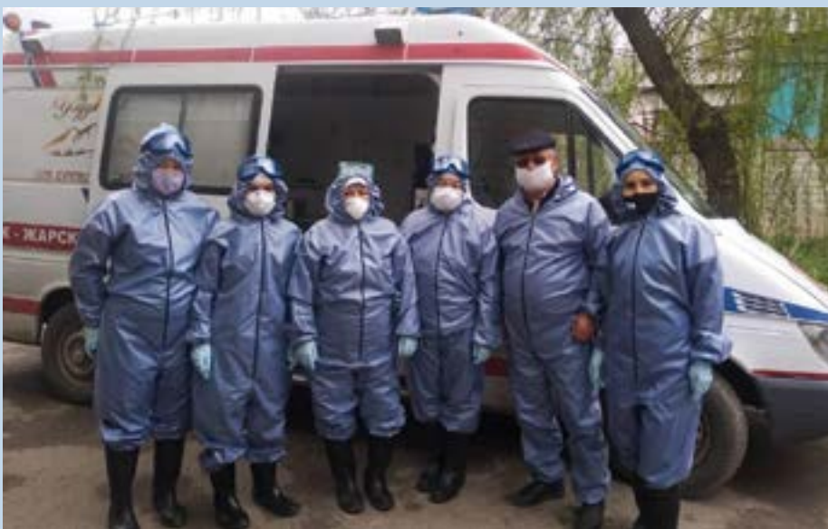
Медработники Ошской области в защитных костюмах, предоставленных АКДН.

Отмечая помощь, предоставленную агентствами АКДН, д-р Шамш Кассим-Лакха, Дипломатический представитель