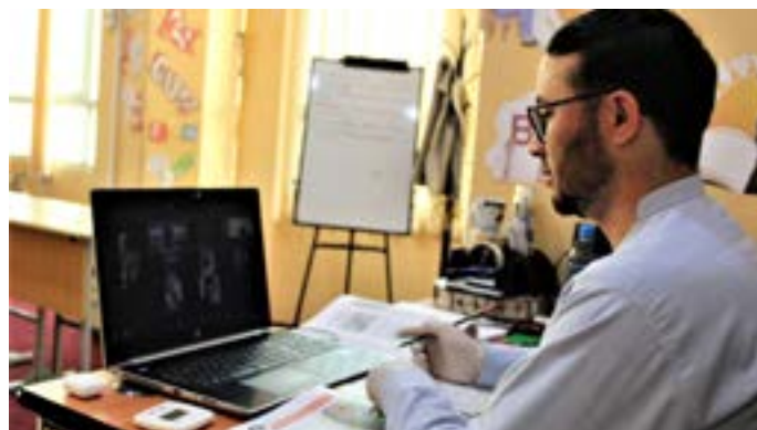
ШПНО в Файзабаде (Афганистан) запустила онлайн уроки английского языка (уровень «intermediate» и «and pre-intermediate»).