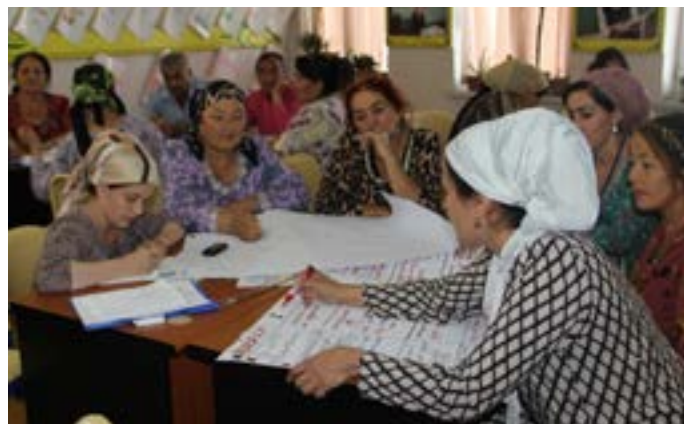
В 2019 году в семинаре по повышению квалификации, который ПРО провела в Хатлоне (Таджикистан), приняли участие более 50 учителей английского языка, математики и химии.

Принимая во внимание потребность учителей в качественном профессиональном развитии, ПРО разработала годовую программу последипломного педагогического образования (ПДПО), которая предусматривает очные и онлайн занятия. Чтобы реализовать программы ПРО в более широком масштабе, в настоящее время в Нарыне на пилотной основе идет реализация стратегии улучшения преподавания и обучения. Она включает в себя тренинги для директоров школ, по составлению планов развития школы, а также работу с преподавателями Нарынского государственного университета и представителями городского отдела образования.