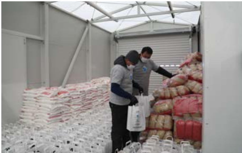
Кампус УЦА: продукты и медицинские товары перед отправкой нуждающимся семьям Нарына.

В марте поддержку УЦА получили 500 нарынских семей (Кыргызстан), которые по данным мэрии города относятся к социально-уязвимым. Именно эта акция и вдохновила на создание Фонда солидарности, который позволит расширить масштабы поддержки. Помимо этого, УЦА подготовил на территории кампуса 90 койко-мест для создания зоны наблюдения в рамках сдерживания инфекции. А чтобы поддержать местную экономику, УЦА закупил матрасы, одеяла, подушки и простыни, которые произвели женщины из сельской местности Нарынской области.