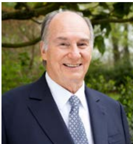
Его Высочество Ага Хан, канцлер УЦА

В УЦА был открыт Отдел международных связей (ОМС), цель которого – направлять деятельность, помогающую обеспечивать высокие академические стандарты и операционную эффективность, через международное сотрудничество и стратегическое партнерство. Отдел будет координировать и продвигать необходимое сотрудничество и стратегические связи, чтобы обеспечивать высокие академиче-