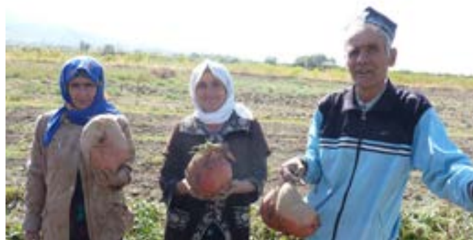
Фермеры Хатлонской области хвастаются богатым урожаем батата.

Институт ботаники, физиологии и генетики растений Таджикистана предоставил ИИГС и МЦК 13 генотипов батата из Перу. Используя метод быстрого размножения, ученые подготовили посадочный материал для фермеров Хатлонской области, характеризующейся дефицитом воды. 20 фермеров получили более 18000 сеянцев 13 генотипов батата, средняя урожайность которых составила 48,7 тонн с гектара. Этот успех удалось повторить и в последующие годы (2017, 2018 и 2019).