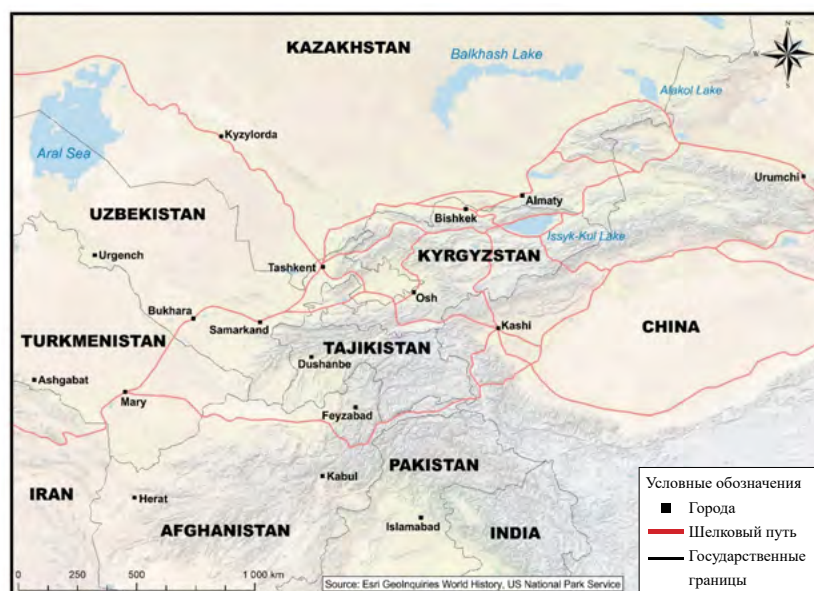
Рисунок 1. Карта древних маршрутов Великого Шелкового пути через регион Центральной Азии со странами, указанными в их нынешних границах.