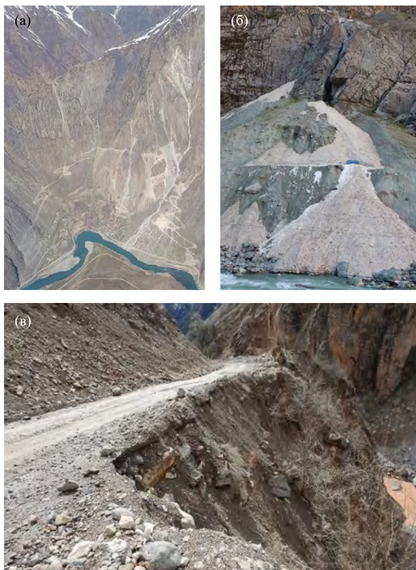
Рисунок 3. (а) Крутые горные дороги, ведущие к горнодобывающим районам и пастбищам на Таджикском Памире; (б) Дорога, соединяющая села на Памиро-Алайском хребте; и (в) Пограничная дорога по афганской стороне вдоль реки Пяндж; обратите внимание на обширный камнепад и синюю машину, очищающую трассу от снежной лавины.

Большая часть запланированной системы дорог в рамках Инициативы пояса и пути в Центральной Азии совпадает с маршрутами древнего Шелкового пути (Рисунок 1). Из-за экономической направленности этого мегапроекта экологические требования, такие как оценка воздействия на окружающую среду (ОВОС) и положения «экологических региональных торговых соглашений» [6, 12–16], были оставлены без внимания. Хотя ОВОС эффективно проводится по многим проектам развития по всему миру, огромный масштаб и международный характер Инициативы пояса и пути затрудняют проведение ОВОС даже в идеальных обстоятельствах, когда все стороны теоретически поддерживают устойчивое развитие.