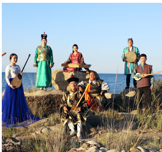
«Аспан жүрегімізде шағылысады» музыкалық жобасының қатысушылары

Орталық әкімшілік кеңсе Қырғызстан, Бішкек қ., 720001, Токтогул қ-сі, 125/1