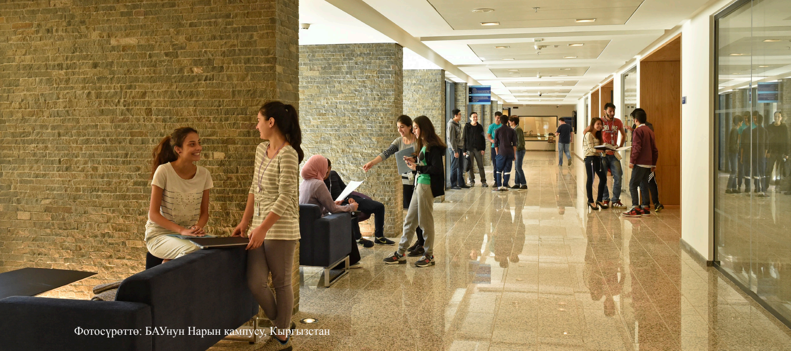
Фотосүрөттө: БАУнун Нарын кампусу, Кыргызстан