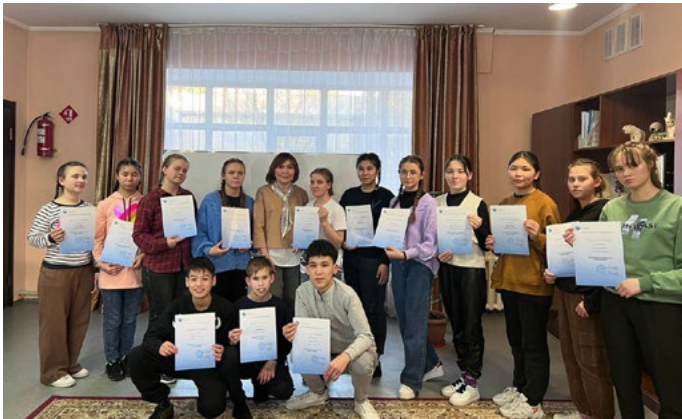
Учащиеся школ Текели, прошедшие тренинг по профориентации от ШПНО.

Школа профессионального и непрерывного образования (ШПНО) УЦА совместно с Министерством образования Казахстана проводит тренинг по профориентации для учащихся школ Текели. В рамках комплексного тренинга школьники проходят психометрические и профориентационные тесты. Учащимся рассказывают о ситуации на рынке труда и о том, какие сферы будут наиболее востребованы в будущем. В конце тренинга участники разрабатывают индивидуальные планы действий для достижения своих целей в карьере.