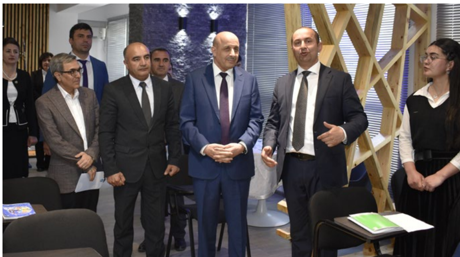
Заместитель губернатора ГБАО и ректор ХГУ восхищены Центром туризма, созданным при поддержке УЦА

В рамках Партнерства горных университетов (ПГУ) Университет Центральной Азии создал в Хорогском государственном университете (ХГУ) ряд ультрасовременных объектов, включая геологические лаборатории, цифровую библиотеку, центр туризма и центр IT-технологий. ХГУ — единственный госуниверситет Горно-Бадахшанской автономной области (ГБАО) Таджикистана.