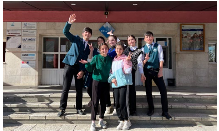
Студенты ШПНО из Хорога, отобранные для участия в программе FLEX 2023 года.

Десять учеников Школы профессионального и непрерывного образования (ШПНО) УЦА были отобраны для участия в состязательной Программе обмена будущими лидерами (FLEX). Эта программа предполагает годовое обучение в одной из средних школ в США. Из десяти отобранных студентов семеро — из кампуса ШПНО в Хороге (Таджикистан), трое — из кампуса ШПНО в Нарыне (Кыргызстан).