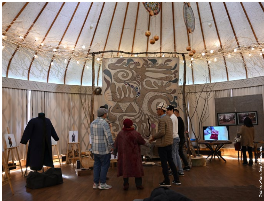
Посетители восхищаются Выставкой УЦА по сохранению кыргызского традиционного искусства

Отдел по культурному наследию и гуманитарным наукам (ОКНГН) Университета Центральной Азии организовал выставку кыргызского традиционного искусства в рамках международной стипендиальной программы «Башат» («Истоки»), которая призвана содействовать сохранению культурного наследия посредством инновационных подходов. Концепция выставки отражает творческое понимание истоков традиций, а также поиск корней и идентичности. «Истоки» — это международная стипендиальная программа, реализуемая при поддержке Всемирного союза духовных