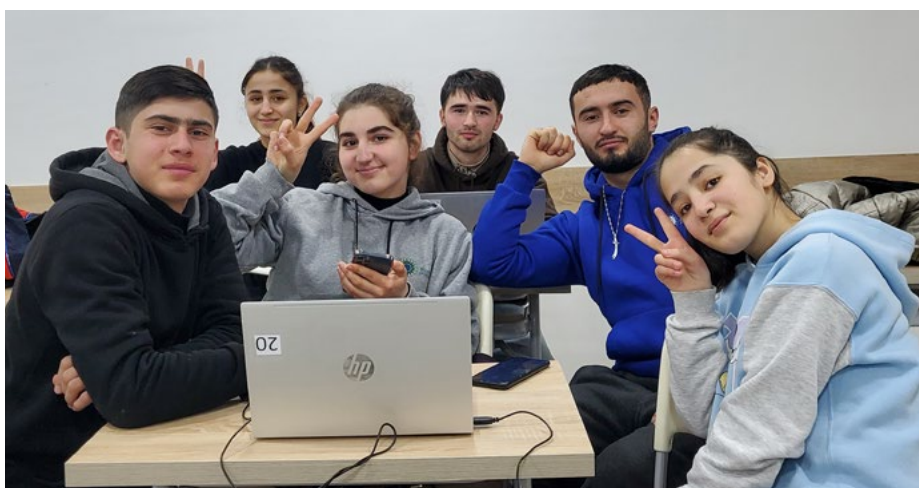
Участники курса цифрового маркетинга ШПНО в г. Худжанд

Школа профессионального и непрерывного образования УЦА недавно запустила бесплатные курсы по цифровому маркетингу в Худжанде (Таджикистан), а также по разговорному английскому языку и основам бухгалтерского учета в Бишкеке (Кыргызстан) для молодежи в возрасте от 18 до 28 лет.