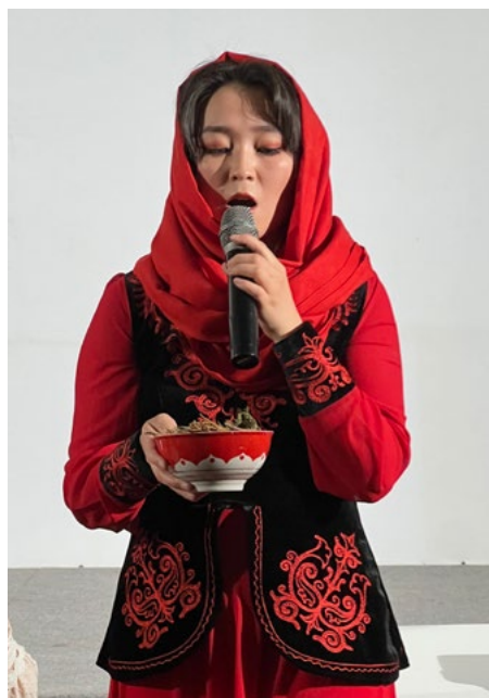
Демонстрация обрядов Навруза в Нарыньском кампусе УЦА