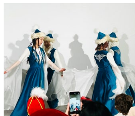
Празднование Навруза в Нарыньском кампусе УЦА