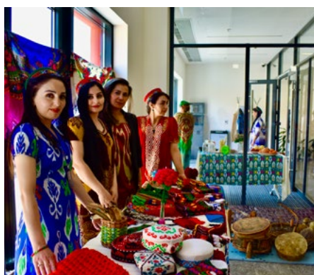
Выставка традиционной одежды, посвященная Наврузу