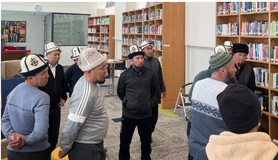
Духовные лидеры из Таласа в ходе визита в Нарынский кампус УЦА.

По просьбе Кади (местного духовного лидера) из Нарынской области (Кыргызстан) Школа гуманитарных и точных наук приняла в Нарынском кампусе группу духовных лидеров из Таласской области. Делегация сочла этот визит интересным и информативным.