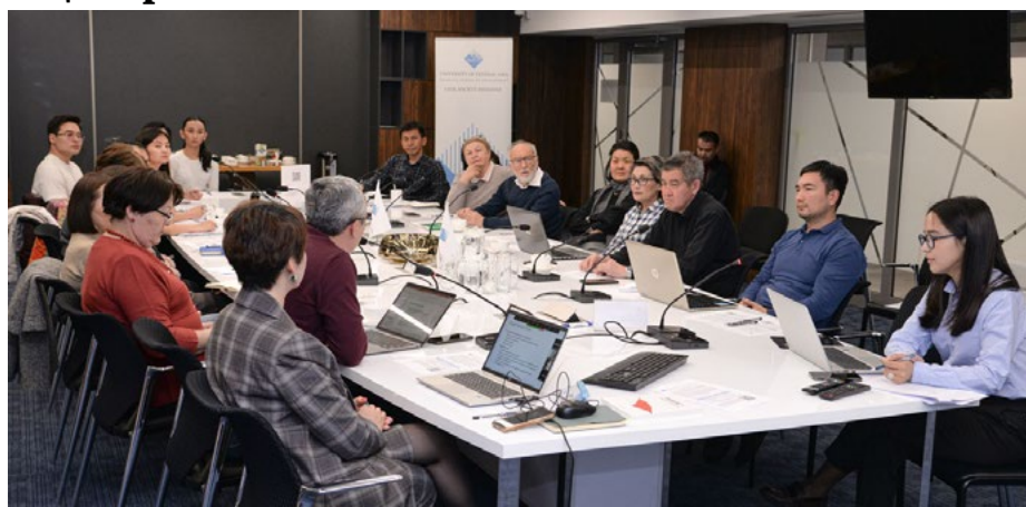
«CSI Talks» в Бишкеке, Кыргызстан

Инициатива гражданского общества (ИГО) Университета Центральной Азии недавно провела ряд очных и онлайн-дискуссий в рамках серии «CSI Talks», посвященной изучению гражданского общества в Кыргызстане и Таджикистане. Представители академических кругов, гражданского общества и международных организаций приняли участие в обсуждении новой повестки дня, направленной на изучение гражданского общества в регионе. Участники обсудили необходимость определения термина «гражданское общество» в расширенном контексте для охвата большей аудитории, не ограничиваясь неправительственными организациями. В рамках ИГО презентовали тему последующих исследований: