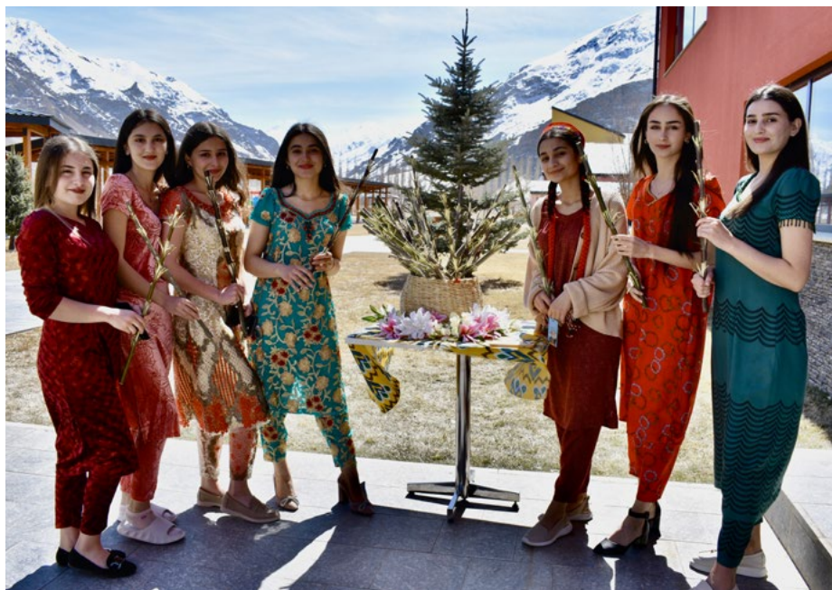
Учащиеся УЦА демонстрируют национальные костюмы

Праздничные мероприятия включали культурную программу с танцевальными, музыкальными и поэтическими выступлениями. Для членов сообщества УЦА это событие также стало возможностью собраться вместе и познакомиться с богатством и разнообразием культур, представленных в УЦА.