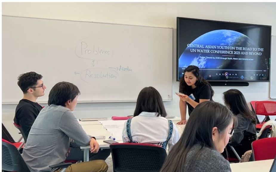
Студенты на семинаре обсуждают влияние изменения климата на водные ресурсы

Этот семинар был проведен в партнерстве с организацией «Молодежь Центральной Азии за водные ресурсы», которая оказывает содействие глобальному молодежному сотрудничеству.