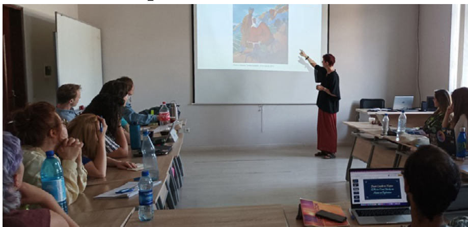
Участники лекции о культурном наследии Центральной Азии.

В сентябре 2022 года Проект Ага Хана «Человековедение» (ПАХЧ) провел трехнедельную международную летнюю школу «Прошлое, настоящее, будущее? Критические подходы к культурному наследию в Центральной Азии» в Душанбе (Таджикистан). В школе приняли участие 19 молодых людей из Германии, Таджикистана, Канады и США, чтобы улучшить свои знания по истории, культуре и языкам Центральной Азии.