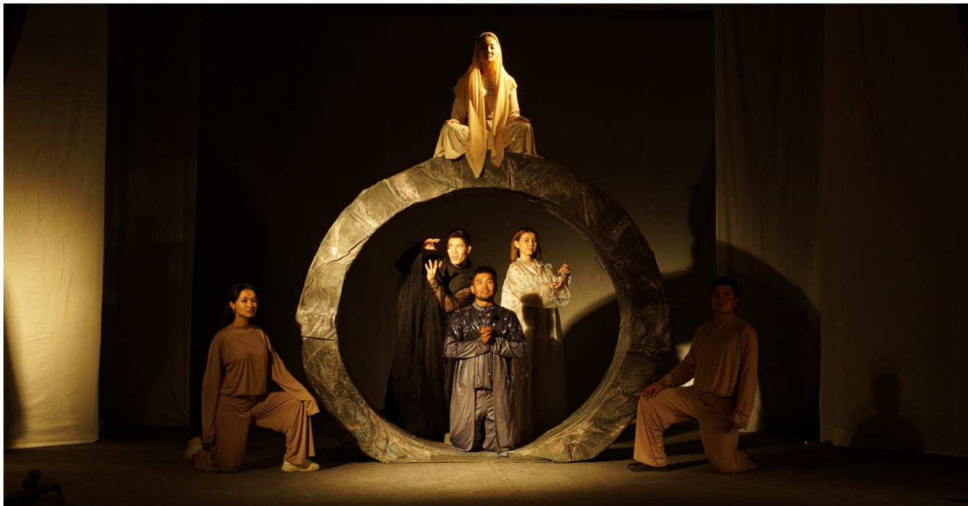
Спектакль "Мать-земля" (Jer Ene) Молодежного экспериментального театра "ART Jashoo".

В течение четырех дней город Нарын, Кыргызстан стал центром международной конференции, исследующей современные и традиционные практики создания изображений через взаимодействие искусства, науки и культуры. С 22 по 25 сентября конференция «Кочевой образ» привлекла художников и международных деятелей, которые внесли свой вклад в эту уникальную культурную феерию, обеспечив ей оглушительный успех.