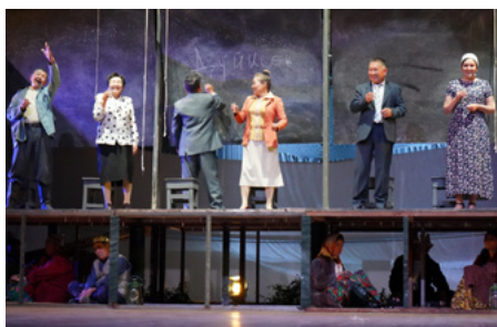
Спектакль "Первый учитель" Чынгыза Айтматова в Нарынском областном академическом музыкально-драматическом театре.

Отдел культурного наследия и гуманитарных наук (ОКНГН) Высшей школы развития УЦА организовал несколько культурных мероприятий во время 7-й трансдисциплинарной конференции «Кочевой образ» (22–26 сентября 2022 года), проходившей в кампусе УЦА в Нарыне. Эти мероприятия объединили местное