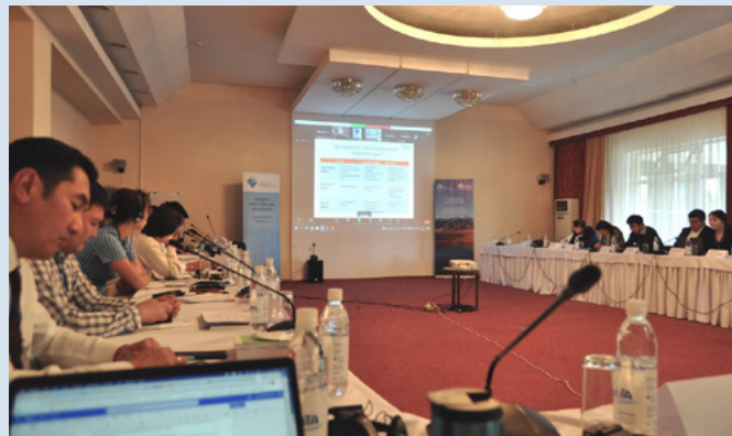
Участники из Центральной Азии и Монголии обсуждают важность учета экологических вопросов при планировании развития.